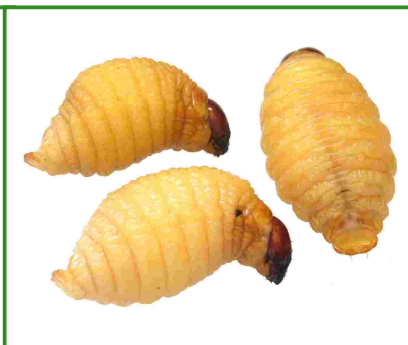
Larves de Rhynchophorus ferrugineus